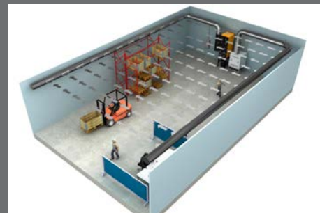
U-vormig push-pull systeem met 1 filterunit en 1 ventilator

Plymovent biedt een breed assortiment hoogwaardige producten om werknemers te beschermen tegen luchtverontreiniging. Om te ontdekken welk systeem bij u past, kunt u contact opnemen met Plymovent of onze website bezoeken: www.plymovent.com .