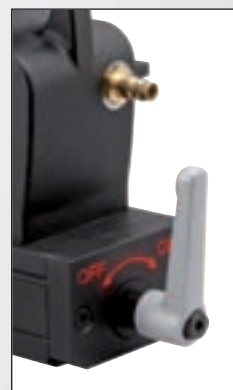
Lever d'activation et de désactivation de l'aimant permanent puissant